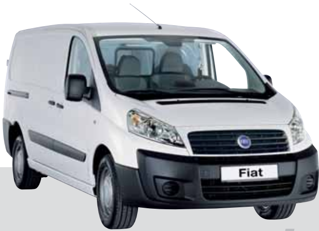
Basisfahrzeug von Fiat

Das ausgefeilte modulare System für alle Anforderungen und ergonomische Arbeitsabläufe.