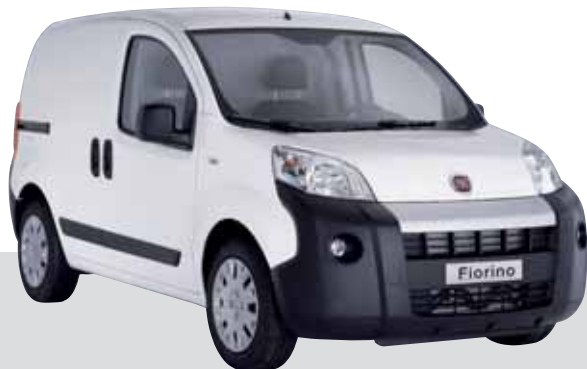
Basisfahrzeug von Fiat

Bei geringer Bauhöhe erzielen Unterflurlösungen hohes Nutzvolumen.