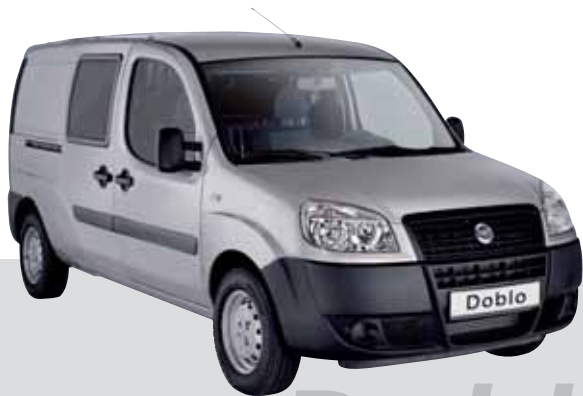
Basisfahrzeug von Fiat

Wir haben ein Prinzip: Das Raumangebot optimal nutzen.