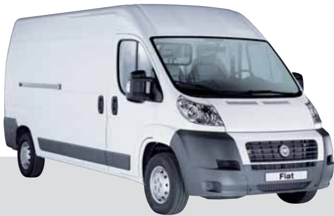
Basisfahrzeug von Fiat

Wir können Ihnen nur Beispiele zeigen. Aber es gibt die ganz spezifische Lösung für Sie.