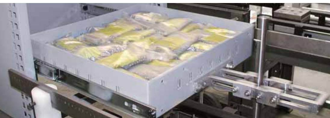
Dauerlauftest und Ausreiβversuch

Um die mobile Sicherheit zu gewährleisten wird bei bott das Thema Ladungssicherung groß geschrieben. Bereits auf den Prüfständen im Werk werden diverse Sicherheitstests durchgeführt wie z.B. Dauerlauftests, Zug- und Ausreiβversuche, Rüttel- und Belastungstests.